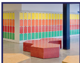
Casiers et systèmes d'armoires